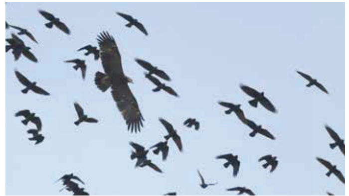
➤ Schreeuwend Clanga pomarina eerste kalenderjaar. 13/10/2019. Hermalle-sous-Argenteau (Lg)

4 mei, Tienen, Bezinkingsputten (VB), 1 2kj+ 4 juni, Doel, Doelpolder Noord (O), 1 ex. De vogel in Tienen betrof een sterk gesleten exemplaar waardoor de identificatie bij de ontdekking op grote afstand best uitdagend was. Gelukkig kwam de vogel dichterbij waardoor de determinatie afgerond kon worden. Dezelfde vogel werd op 14 en 15 mei waargenomen te Yerseke (NL) en Hulst (NL) en werd aanvaard door de CDNA, de Nederlandse zeldzaamhedencommissie (Webref 1).