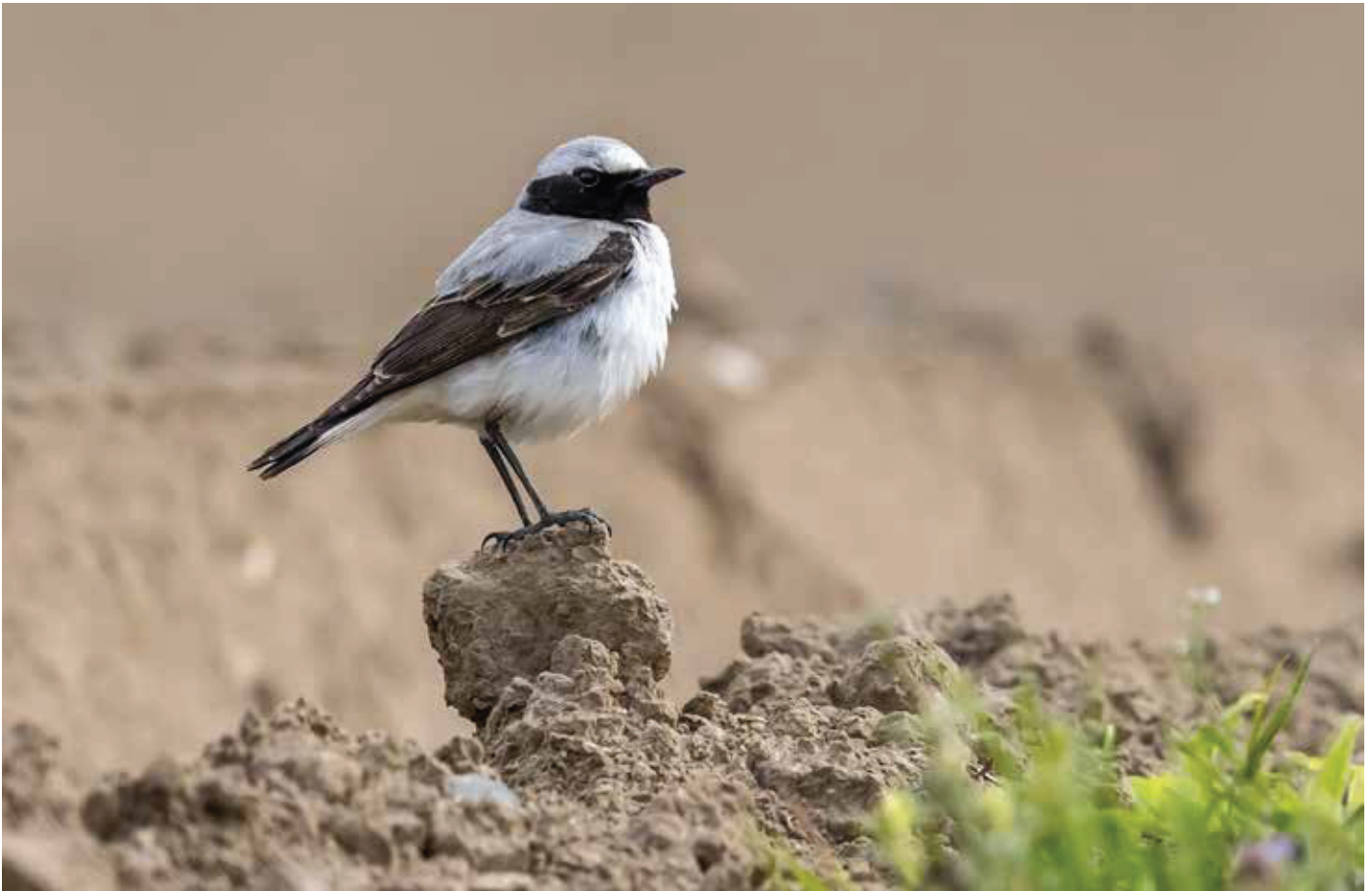
Seebohms Tapuit Oenanthe oenanthe seebohmi tweede kalenderjaar mannetje. 7/05/2019. Templeuve (H)