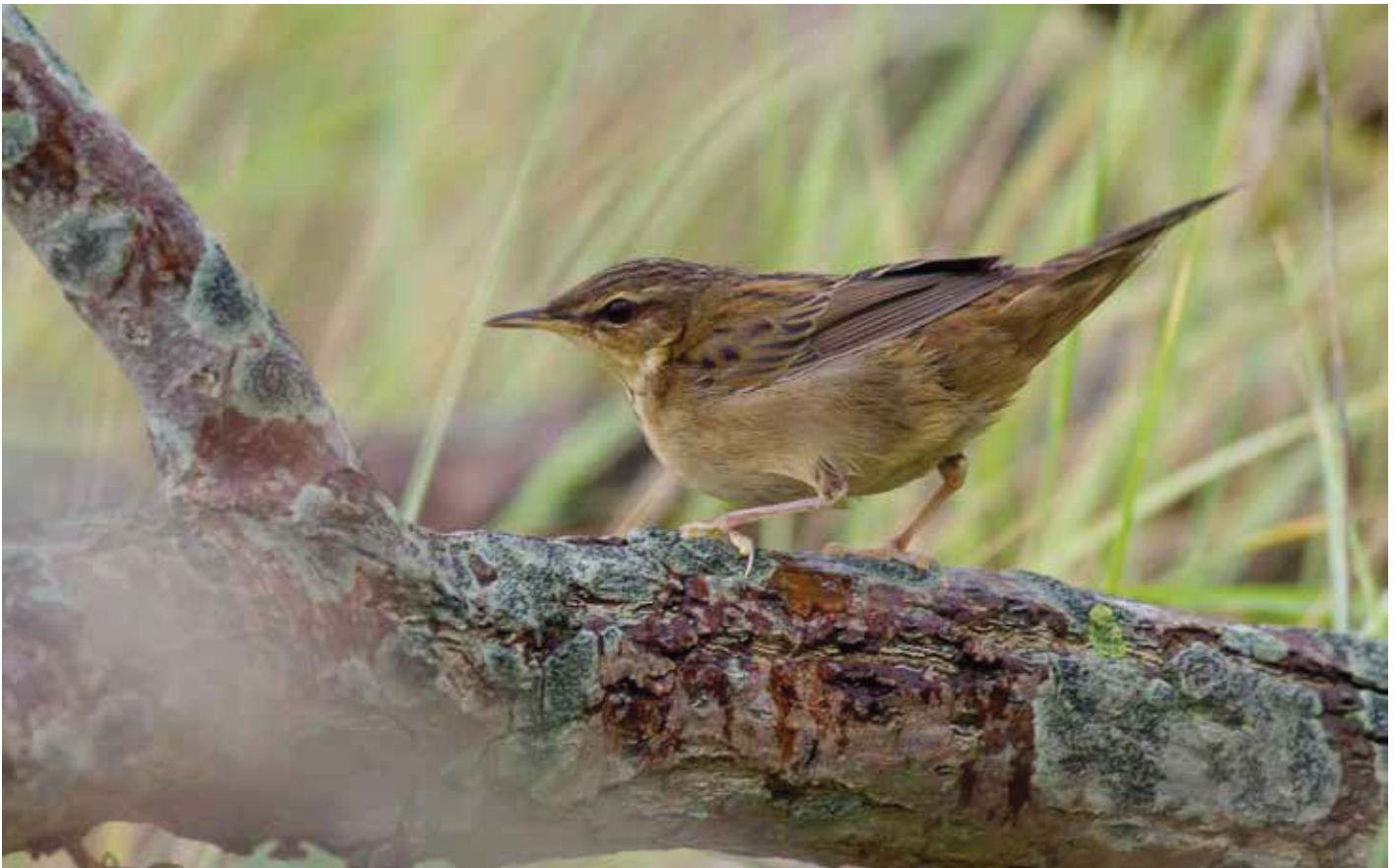
▮ Siberische Sprinkhaanzanger Helopsaltes certhiola eerste kalenderjaar. 11/10/2019. Heist (W)