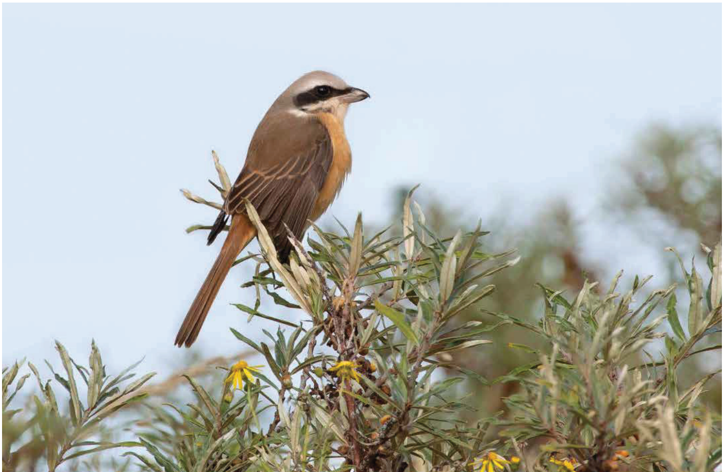
➤ Filipijnse Bruine Klauwier Lanius cristatus lucionensis adult mannetje. 25/10/2019. Zeebrugge (W)

25 - 29 oktober, Zeebrugge / Heist, Voorhaven / De Sashul (W), 1 m. ad. Bruine Klauwier kent vier ondersoorten: L. c. cristatus , L. c. lucionensis , L. c. superciliosus and L. c. confusus (Svensson 1992). Volgens het