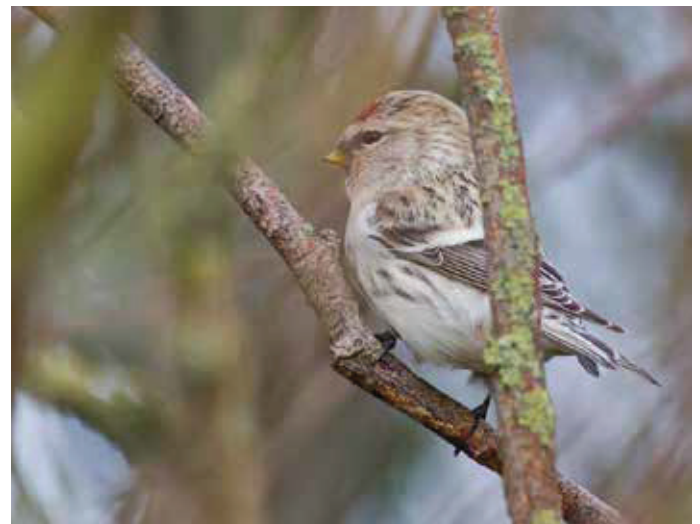
► Witstuitbarmsijs Acanthis hornemanni eerste kalenderjaar vrouwtje. 1/11/2018. Heist (W)

Bosgors Emberiza rustica 17 oktober, Herstappe (L), 1 ex.