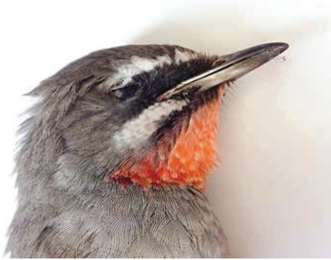
► Roodkeelnachtegaal Calliope calliope eerste kalenderjaar mannetje. 4/12/2019. Hailot (N)

Siberische Taling Sibirionetta formosa 19 januari - 19 april, Schilde (A), 1 ex.