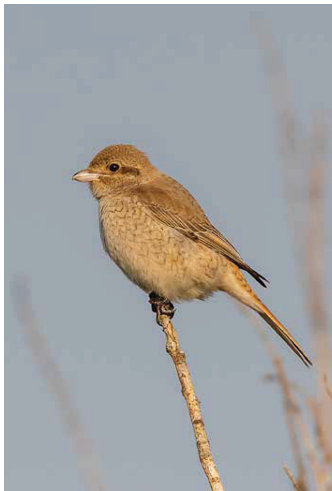
› Daurische Klauwier of Turkestaanse Klauwier Lanius isabellinus / L. phoenicuroides eerste kalenderjaar. 14/10/2019. Heist (W)

13 - 17 oktober, Antwerpen, De Kuifeend (A), 1 1kj+ ringvangst (Bram Vogels)