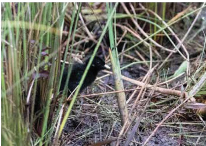
▶ Kleinst Waterhoen Zapornia pusilla pullus . 19/07/2019. Harchies (H)