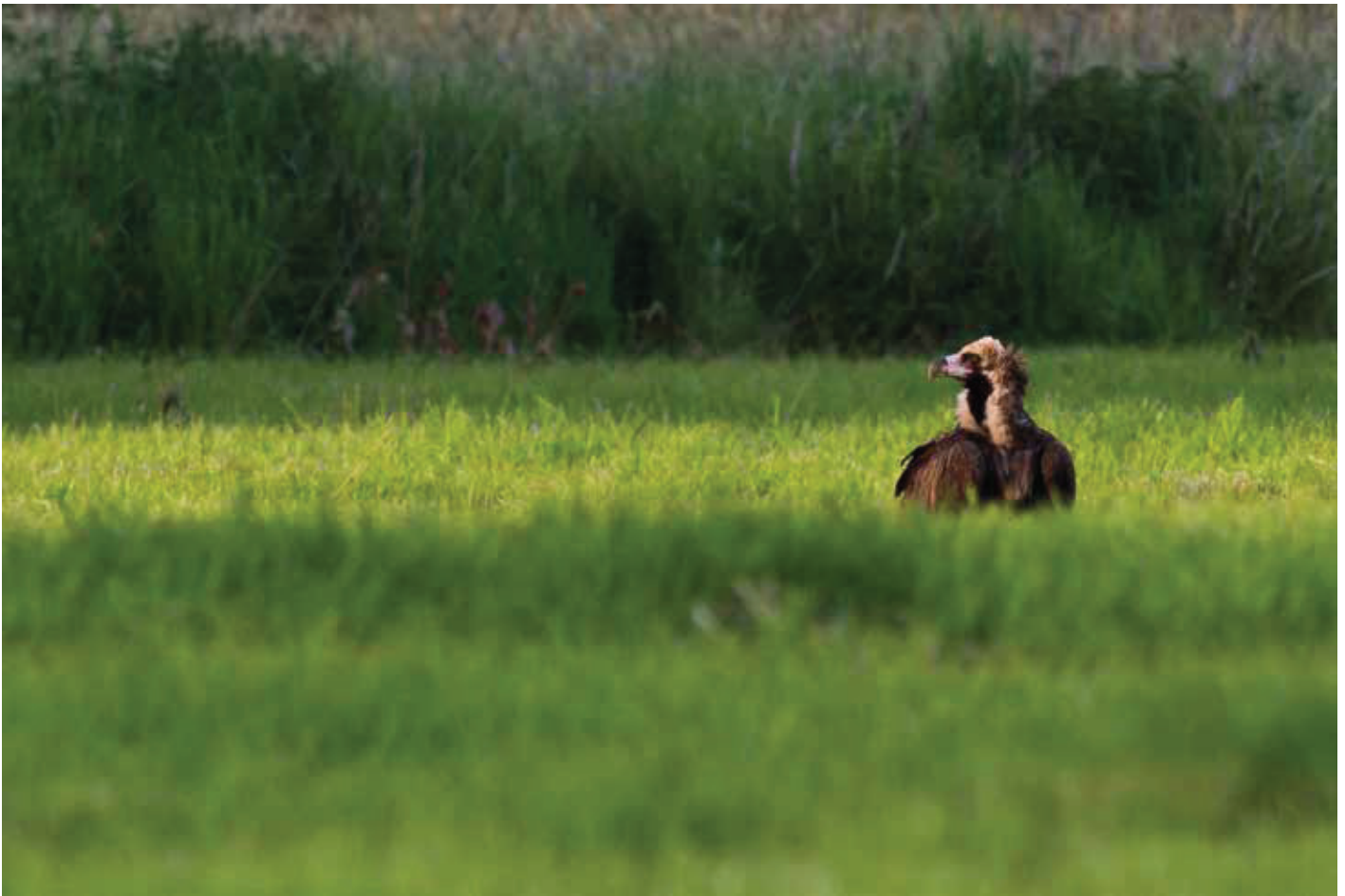
Monniksgier Aegypius monachus vierde kalenderjaar vrouwtje. 08/05/2019. Heist-op-den-Berg (A)