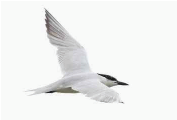
› Lachstern Gelochelidon nilotica . 11/08/2019. Kieldrecht (O)

30 maart, Ieper, Verdrongen weiden (W), 1 4kj Het laatste geaccepteerde geval van Ringsnavelmeeuw dateert van 2015. Het begin van de lente is duidelijk de beste periode om de soort te vinden, met 10 ontdekkingen in maart en 8 in april. Zowel West-Vlaanderen als Oost-Vlaanderen kennen 11 gevallen van deze nearctische meeuwensoort.