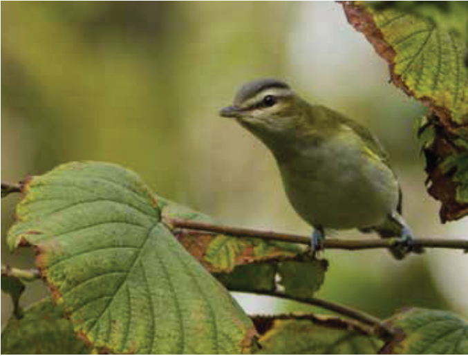
➤ Roodoogvireo Vireo olivaceus . 13/10/2019. Heist (W)