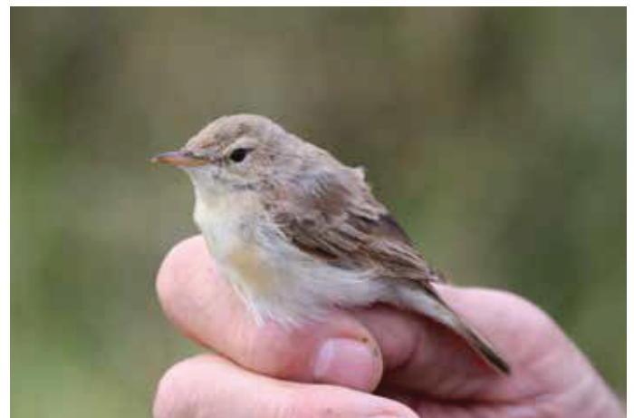
▮ Kleine Spotvogel Iduna caligata . 13/10/2019. Antwerpen (A)

13 oktober, Zeebrugge, Visserskruis (W), 1 1kj